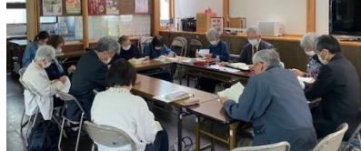
教会学校 成人科クラス

子どもたちのクラス(幼稚科・小学科)では、晴れた日に教会の庭で遊ぶこともあり、夏にはお泊まり会、冬にはクリスマス会などで楽しく過ごします。