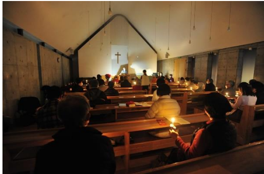
クリスマスイブ燭火礼拝

すべての人を照らす そのまことの光が 世に来ようとしていた。 ヨハネ 1:6 (新改訳)