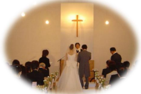
新しい人生の門出

私たちの所属する日本バプテスト連盟には約316の教会、伝道所があります。また、福岡の西南学院大学や、北九州の西南女学院、京都のバプテスト病院や、特別養護老人ホームなどの学校や施設も、連盟の関係団体です。