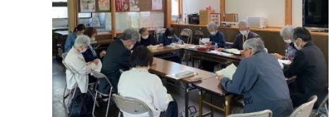
教会学校 成人科クラス