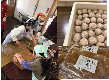
くりくりあおぞらくらぶ (みそ作り)