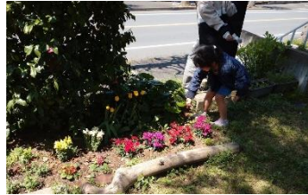
イースター 教会の庭で卵さがし

子どもたちのクラス(幼稚科・小学科)では、晴れた日に教会の庭で遊ぶこともあり、夏にはお泊まり会、冬にはクリスマス会などで楽しく過ごします。