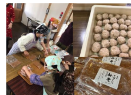
くりくりあおぞらくらぶ(みそ作り)