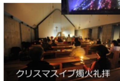
クリスマスイブ燭火礼拝

子どもたちのクラス(幼稚科・小学科)では、晴れた日に教会の庭で遊ぶこともあり、夏にはお泊まり会、冬にはクリスマス会などで楽しく過ごします。