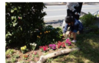
イースター 教会の庭で卵さがし