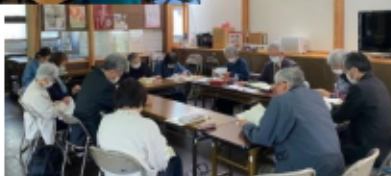
教会学校 成人科クラス