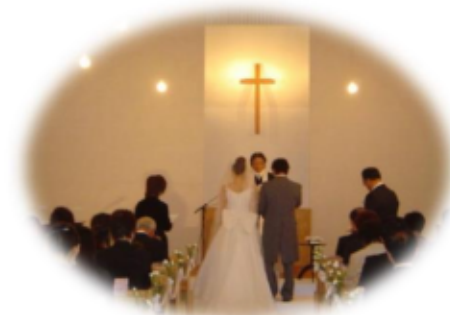
新しい人生の門出